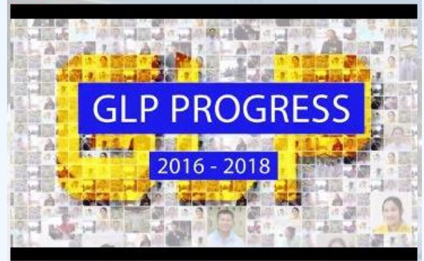
สมาคมฯ ได้จัดทำ VDO GLP Progress 2016-2018 เพื่อส่งเสริมคณะกรรมการสวัสดิการในสถานประกอบกิจการ และติดตามผลจากการดำเนินการที่ผ่านมา สามารถเข้าไปดูได้ที่ http://www.thaituna.org/home/index.php