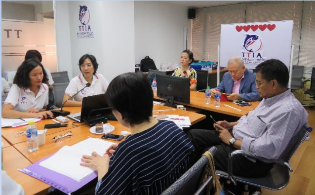
สมาคมฯ ได้จัดประชุมวิสามัญ TTIA ครั้งที่ 1/2562 เวลา 09.30 – 12.00 น. มีสมาชิกเข้าร่วมครบองค์ประชุม อ่านต่อหน้า 8